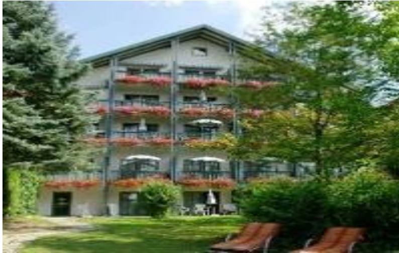
Banja Bad Grizbah