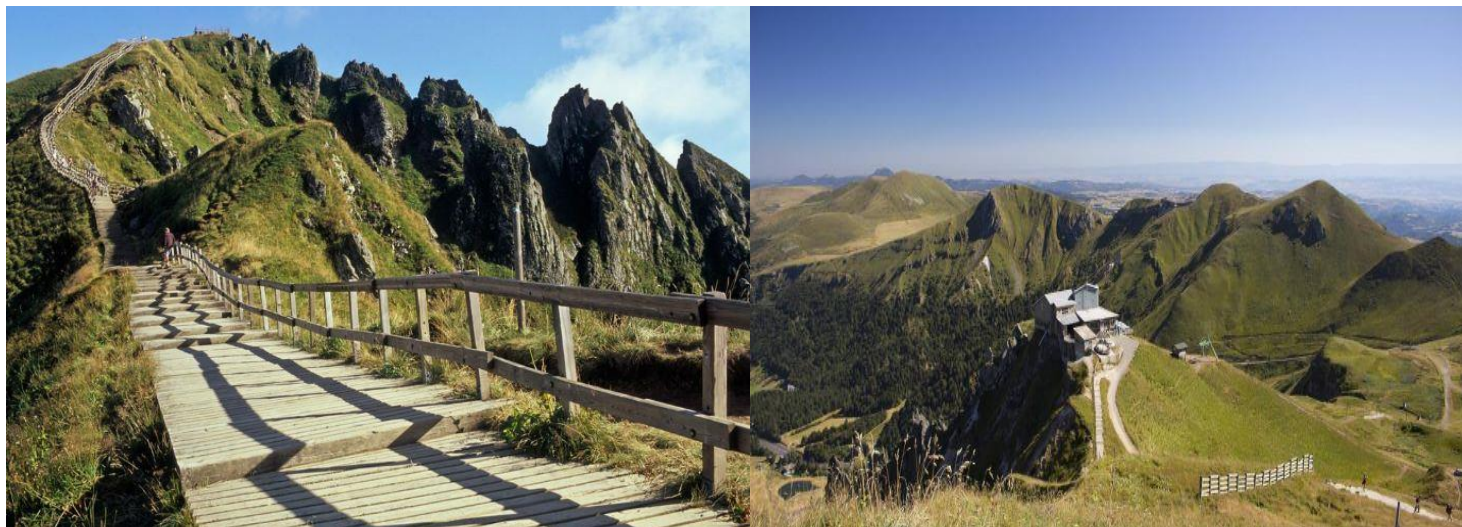
Ka vrhu masiva Sansi

14.30 – 16.30 U nastavku dana, boravak na jezeru Šambon ( Lac Chambon ), nastalom kao posledica erupcije vulkana Tartaret. Fakultativno: ako ne budemo previše umorni, možemo da napravimo šetnju oko jezera (kružnom stazom koja polazi od parkinga pored jezera, obeležena žutom markacijom), za šta je potrebno oko sat vremena. Jezero ima i druge sadržaje, restorane, kafiće, a okruženo je divnom prirodom. Pauza za odmor i osveženje.