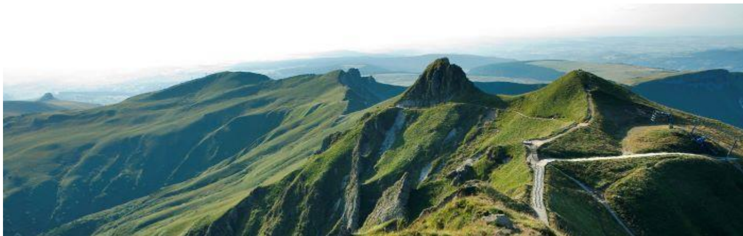
Masiv i vrh Sansi