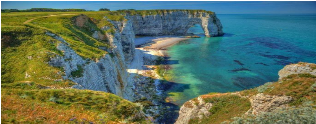
Pešačka staza iznad litica Etrete

14.30-16.30 Slobodno vreme za individualan obilazak Onflera , kolevke impresionizma, sa starim kvartom uz obalu gde su smeštena skladišta soli, drveni hram Svete Katarine i prastari dokovi. Srce grada nalazi se oko stare luke, gde se mogu videti skromne ribarske lađe usidrene pored skupih jahti. Iz ove luke kretali su francuski kolonisti u osvajanje novog sveta. Onfler ima bogatu kulturnu istoriju i pun je jarko obojenih zgrada, kao i velikih normanskih drvenih kuća.