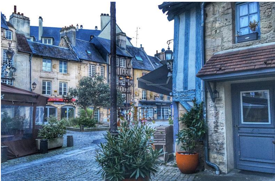
Stari kvart Kaena

18.00 Dolazak u Avr . Smeštaj. Slobodno vreme za individualan obilazak grada.