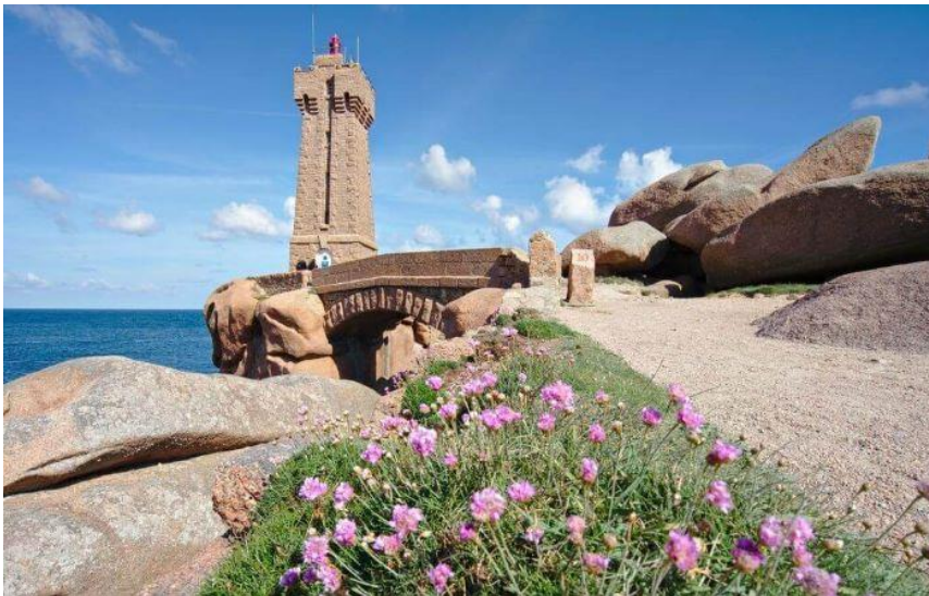
Obala ružičastog granita

16.00-18.00 Pešačenje po jednom delu pešačke staze GR34 – Carinička staza (Sentier des Douaniers), duž čuvene