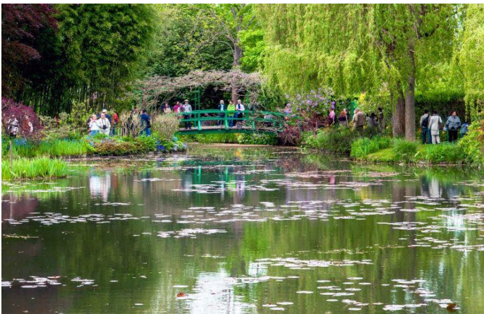
Moneov vrt u Živerniju

9.30-12.00 Slobodno vreme za individualan obilazak Živernija , gde je 43 godine živeo otac impresionizma, Klod Mone. Njegovu kuću, baštu i jezero sa vodenim ljiljanima i japanskim mostićima godišnje obiđe pola miliona turista. Obilazak Moneovog vrta i kuće biće unapred organizovan, a cena karte za grupu je 8 evra, po osobi. Samo selo je jako malo i može se obići za pola sata.