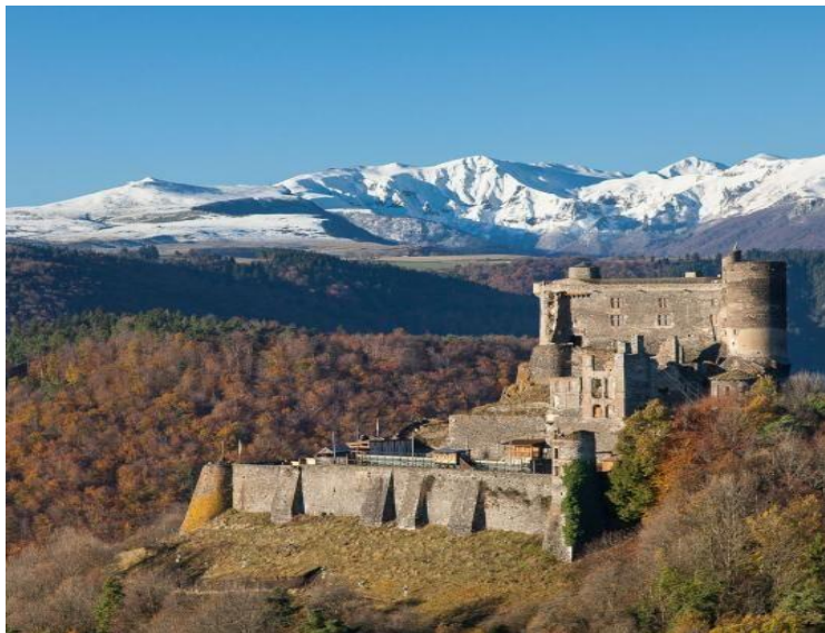
Dvorac Murol i masiv Sansi

19.15 Povratak u Klermon Feran. Slobodno vreme.