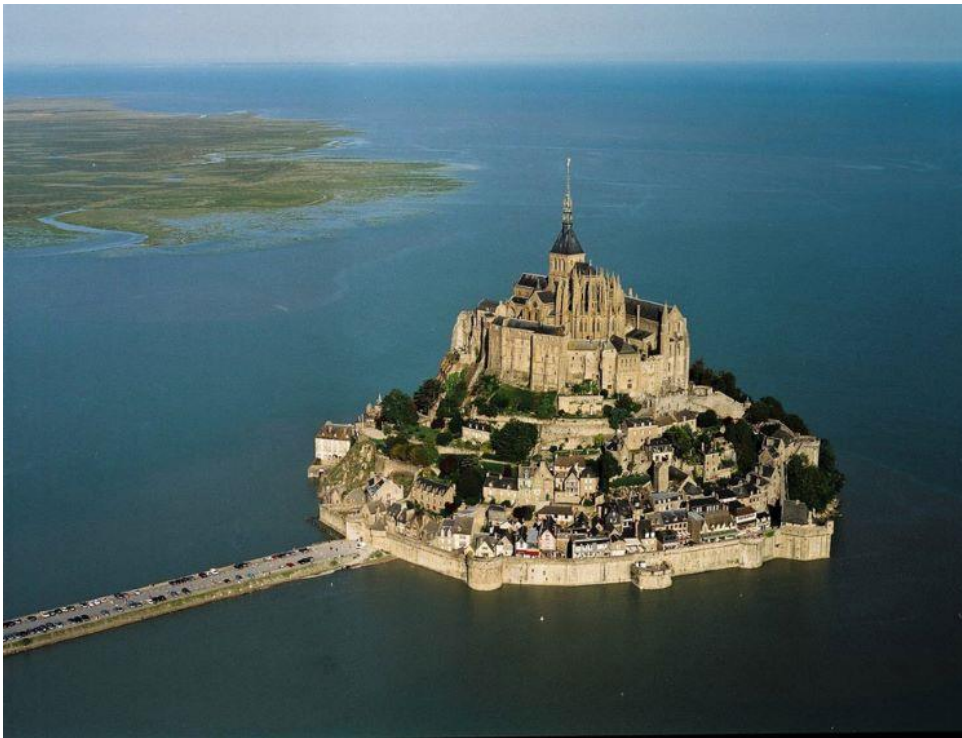
Mon Sen Mišel

od 1948. do 1962. godine. Glavna gradska atrakcija je dvorac iz 11. veka (danas muzej), koji je i jedno od najvećih srednjovekovnih utvrđenja u zapadnom delu Evrope.