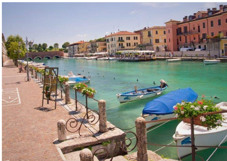
Peskijera del Garda