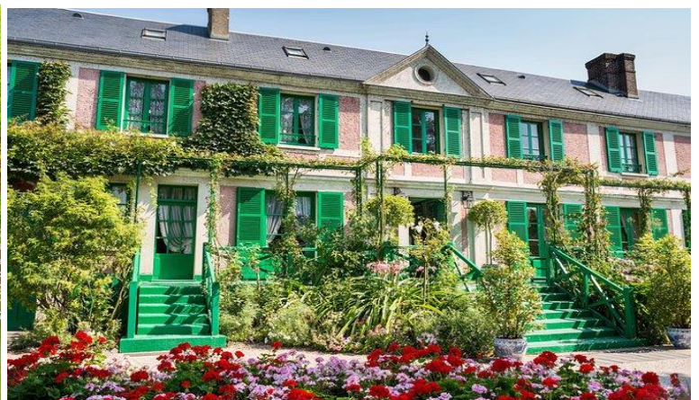
Moneova kuća u Živerniju

13.00-17.00 Obilazak Versaja i vrtova. Detalji oko organizovane posete Versaja biće vam dostavljeni naknadno. Cena karte je oko 20 evra. Detaljno o Versaju, tokom putovanja.