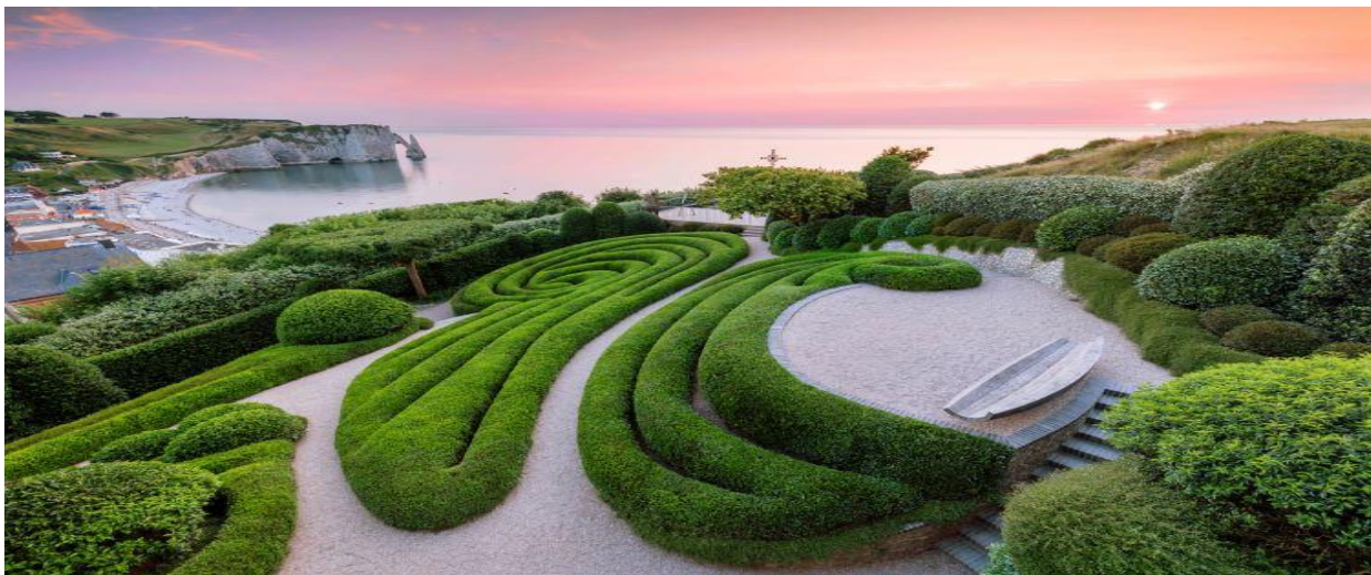
Vrtovi Etrete, sa pogledom na grad i klifove

11.00-11.30 Kratka šetnja stazom u blizini Vrtova, koja ide obodom strmih klifova, sa prelepim vidikovcima.